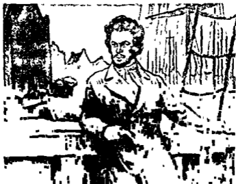
कार्ल मार्क्स हालैंड-यात्रा के दौरान। चित्रकार - फ० ग्लेवोव